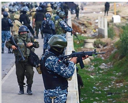
15.11.19: Sacaba/Cochabamba. Militär schießt in Demo

Eine dieser Maßnahmen ist ein am Freitag (15.11.) erlassenes Regierungsdekret (Dekret 4078), das erlaubt, dass Militärangehörige bei der Unterdrückung von Protesten "alle verfügbaren Mittel nutzen können, die dem Risiko der Operationen proportional sind", und dass sie dabei von der "strafrechtlichen Verantwortung" befreit sind.