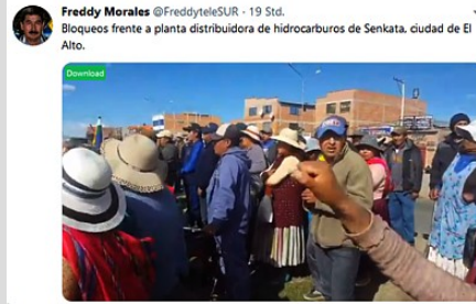
Blockade des Werkes für Treibstoff in Senkata

Veröffentlicht: Montag, 18. November 2019 10:19