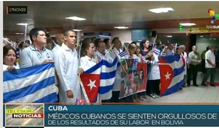
Die cubanische Mediziner*innenbrigade verlässt Bolivien

Zu dieser "Neuausrichtung" gehört die umgehende Anerkennung des selbsternannten Präsidenten Venezuelas, Juan Gaidó, als "legitimer Präsident". Dem folgte der Abbruch der diplomatischen Beziehungen zu Venezuela. Longaric erklärte zudem den Austritt aus der Bolivarischen Allianz Alba, an der Venezuela, Cuba, Nicaragua und weitere linksgerichtete Länder der Region beteiligt sind.