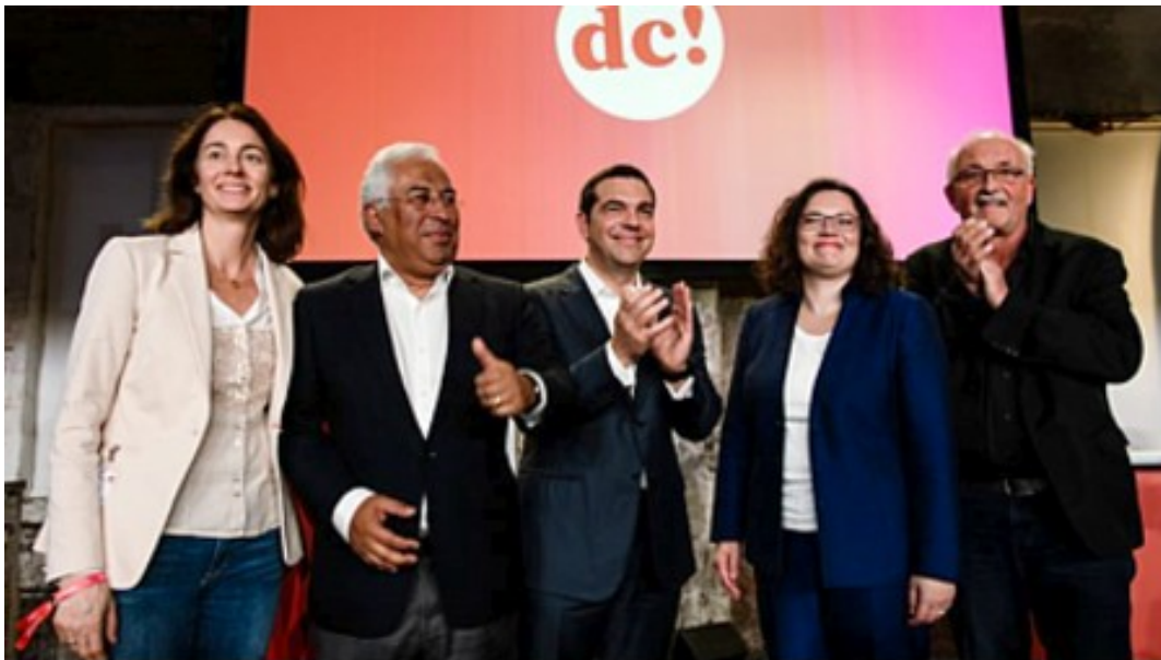
Katarina Barley - Antonio Costa - Alexis Tsipras - Andrea Nahles - Udo Bullmann

Im Sommer hatte Mélenchon ohne Erfolg versucht, SYRIZA aus der EL auszuschließen. Aber auch von anderer Seite wurde und wird an SYRIZA gezogen. Die Sozialdemokratie umwarb Tsipras, um SYRIZA im künftigen Europaparlament auf die Seite der Fraktion der "Progressiven Allianz der Sozialdemokraten" (S&D) zu ziehen.