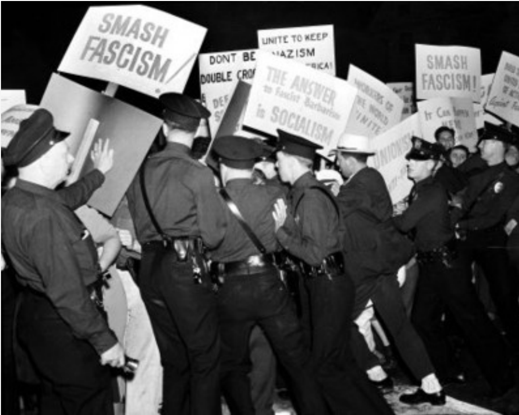
Volksfront gegen Faschismus: Eine Phalanx von Polizisten schreitet gegen von der Kommunistischen Partei organisierte anti-Nazi-Demonstranten ein, Los Angeles, Calif., Aug. 7, 1938.

Die Volksfront bedeutete für die Kommunisten den Abschied von sektiererischem und doktrinärem 'Tu's allein' Herangehen, das davon ausging, nur die organisierte Arbeiterklasse sei nötig, um den Kapitalismus zu überwinden und das nichts als die totale Revolution etwas nützen würde. Rassismus und andere Probleme würden verschwinden nach Erringung des Sozialismus ; der Klassenkampf würde solche Fragen lösen. Stattdessen vertrat die Partei jetzt, daß eine Veränderung hier und jetzt erreicht werden könnte, und zwar durch den gemeinsamen Einsatz von Arbeitern, unterdrückten Gruppen und Allen, die ein Interesse am Stop des Abstiegs in reaktionäre Politik und am Kampf gegen Rassismus und gegen Spaltung haben. Das war der Weg, das Kräfteverhältnis zu ändern und den Weg zum Fortschritt zu öffnen.