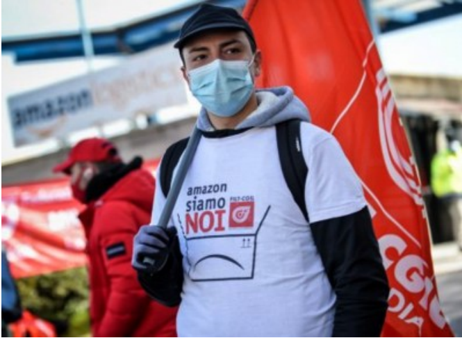
Amazon sind wir

"Unentbehrliche Arbeitskräfte, wie sie ständig von allen definiert werden, wie wir sie sicherlich alle wahrgenommen haben und weiterhin wahrnehmen, aber sie werden nicht als solche behandelt", heißt es in einem gemeinsamen Schreiben der drei Gewerkschaften an die italienischen Haushalte. Die Fahrer*innen müssen "den Angaben eines Algorithmus folgen, der weder die Normen der Regulierung der Zeiten des Lebens und der Arbeit kennt, noch viel weniger die des Verkehrs unserer Städte", heißt es weiter. "In den Lagern", so fahren Filt Cgil, Fit Cisl und Uiltrasporti in dem Appell an die Bürger*innen fort, "arbeiten sie 8 Stunden mit einer Mittagspause von einer halben Stunde, ohne Kontrolle der Arbeitsschichten. Keine Verhandlungen, keine Diskussion mit den Vertretungsorganisationen über das auferlegte Arbeitstempo und für die Anerkennung von Gewerkschaftsrechten. Keine Sozialklausel oder Beschäftigungskontinuität für Fahrer*innen im Falle eines Lieferantenwechsels. Keine Entschädigung für die gestiegenen Belastungen durch Covid-19."