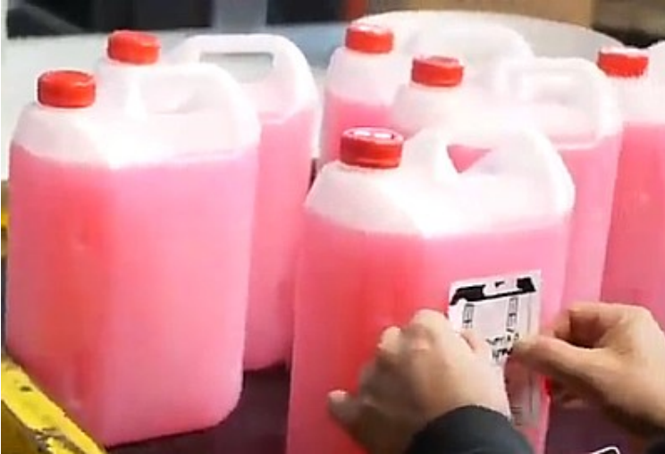
Seife für die Geflüchteten in den Lagern

Die Stromversorgung ist elementar für das Funktionieren der Seifenproduktion. Die Polizei hat sich zwar wieder zurückgezogen, die Beschäftigten benötigen zum Aufrechterhalt des Betriebs elektrischen Strom. Die Vio.Me-Arbeiter*innen behelfen sich mit geliehenen Generatoren und produzieren auf kleinerer Flamme weiter. Flüchtlingslager und soziale Einrichtungen auch auf den Inseln werden vorrangig vor allem mit Seife beliefert.