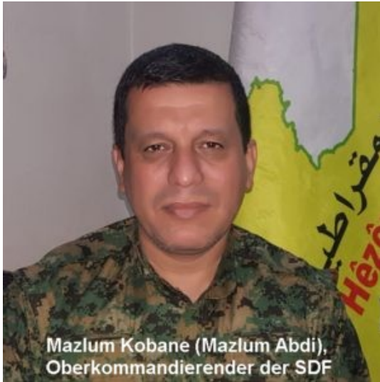
Mazlum Kobane (Mazlum Abdi), Oberkommandierender der SDF

Frage: Überall wird über eine "Sicherheitszone" oder "Pufferzone" in Nordsyrien diskutiert. Wie benennen Sie dieses geplante Gebiet?