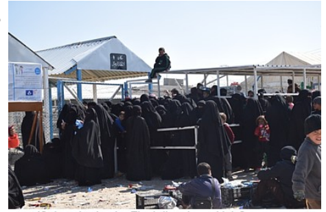
IS-Angehörige im Flüchtlingslager Hol-Camp

zurückzunehmen. Wie Omar erklärte, könne angesichts der türkischen Invasionsdrohungen nicht länger für die Sicherheit der Gefängnisse gesorgt werden.