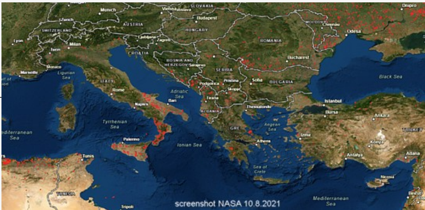
Das Bild zeigt die Brände. Jeder rote Punkt ist ein Brandherd

Die immer schnellere Abfolge von Extremwetterereignissen, hier und weltweit, ist eine Folge der Erderhitzung. Wetterextreme wie anhaltende Starkregen und Hitzewellen werden zukünftig immer häufiger auftreten, sagt der Weltklimarat in seinem jüngsten Bericht. In neun Jahren könnte der Anstieg der globalen Mitteltemperatur 1,5 Grad überschreiten, prognostiziert der Weltklimarat – und warnt vor nie erreichten Extremwetterereignissen. Der Trend lässt sich nur verlangsamen.