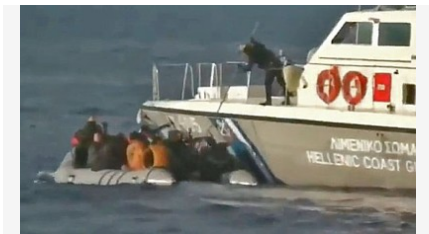
Griechische Küstenwache stößt Boot mit Flüchtenden mit Stangen zurück