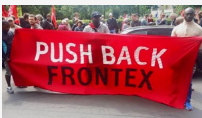
Frontex erstmals vor dem EU-Gerichtshof für Menschenrechte

Schließlich schaltete sich die EU-Betrugsbekämpfungsbehörde Olaf ein, nahm Ermittlungen auf und erstellte einen 200-seitigen Bericht. Im Februar informierte Olaf-Generaldirektor Ville Itälä