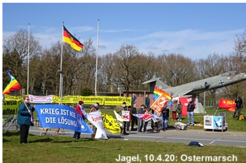
Jagel, 10.4.20: Ostermarsch

Kategorie: Aus Bewegungen und Parteien Veröffentlicht: Montag, 13. April 2020 11:58