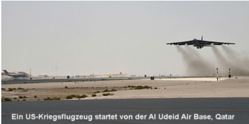
Ein US-Kriegsflugzeug startet von der Al Udeid Air Base, Qatar