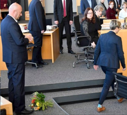
5.2.2020: Susanne Hennig-Wellsow (DIE LINKE) wirft den Blumenstrauß vor die Füße von Thomas Kemmerich (FDP), der mit den Stimmen der AfD zum Ministerpräsidentengewählt wurde.

https://twitter.com/ChrisCldtz/status/1225046067076571136