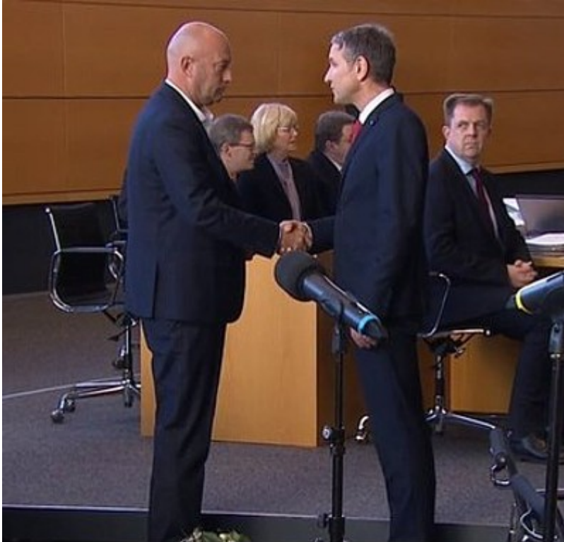
5.2.2020: Björn Höcke (AfD) gratuliert Thomas Kemmerich (FDP), der mit den Stimmen der AfD zum Ministerpräsidenten von Thüringen gewählt wurde.

05.02.2020: In Thüringen ist heute der FDP-Kandidat Thomas Kemmerich mit den Stimmen der AfD zum Ministerpräsidenten gewählt worden. Und das auch noch vom Landesverband des Faschisten Björn Höcke. ++ Reaktionen auf die Wahl von Thomas Kemmerich