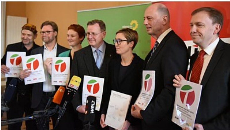
4.2.2020: rrg präsentiert Koalitionsvertrag für eine Minderheitsregierung