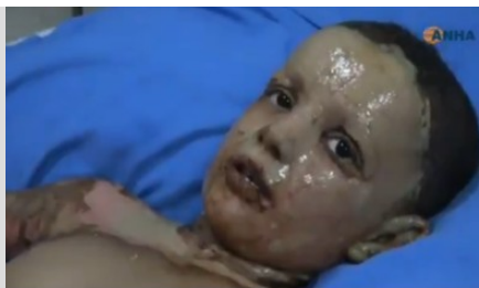
16.10.19: Einsatz "unkonventioneller" Waffen durch die Türkei. Quelle: https://twitter.com/i/status/1184605697771757574

https://twitter.com/mustefabali/status/1184605697771757574 )