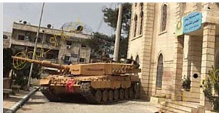
18.3.18: Leopard-Panzer vor dem Rathaus von Afrin

Dabei hat die Türkei in den ersten acht Monaten dieses Jahres bereits Kriegswaffen für 250,4 Millionen Euro aus Deutschland erhalten - der höchste Jahreswert seit 2005, obwohl noch vier Monate fehlen. Im vergangenen Jahr gingen fast ein Drittel aller deutschen Kriegswaffenexporte in die Türkei. Mit einem Umfang von 242,8 Millionen Euro hatte die Türkei den Spitzenplatz bei den deutschen Rüstungsexporten. Abgesichert werden die Exporte von der Bundesregierung mit Hermes-Bürgschaften; seit Anfang 2018 mit rund 2,6 Milliarden Euro.