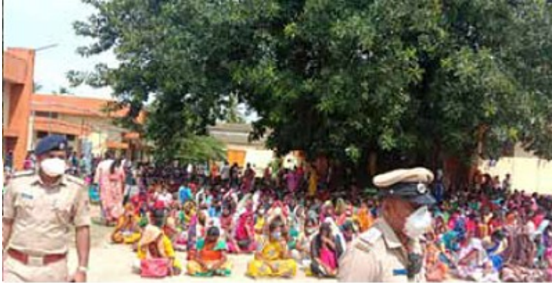
Juni 2020: Protest der Beschäftigten des H&M-Zulieferers Gokaldas Exports in Srirangapatna im indischen Bundesstaat Karnataka.