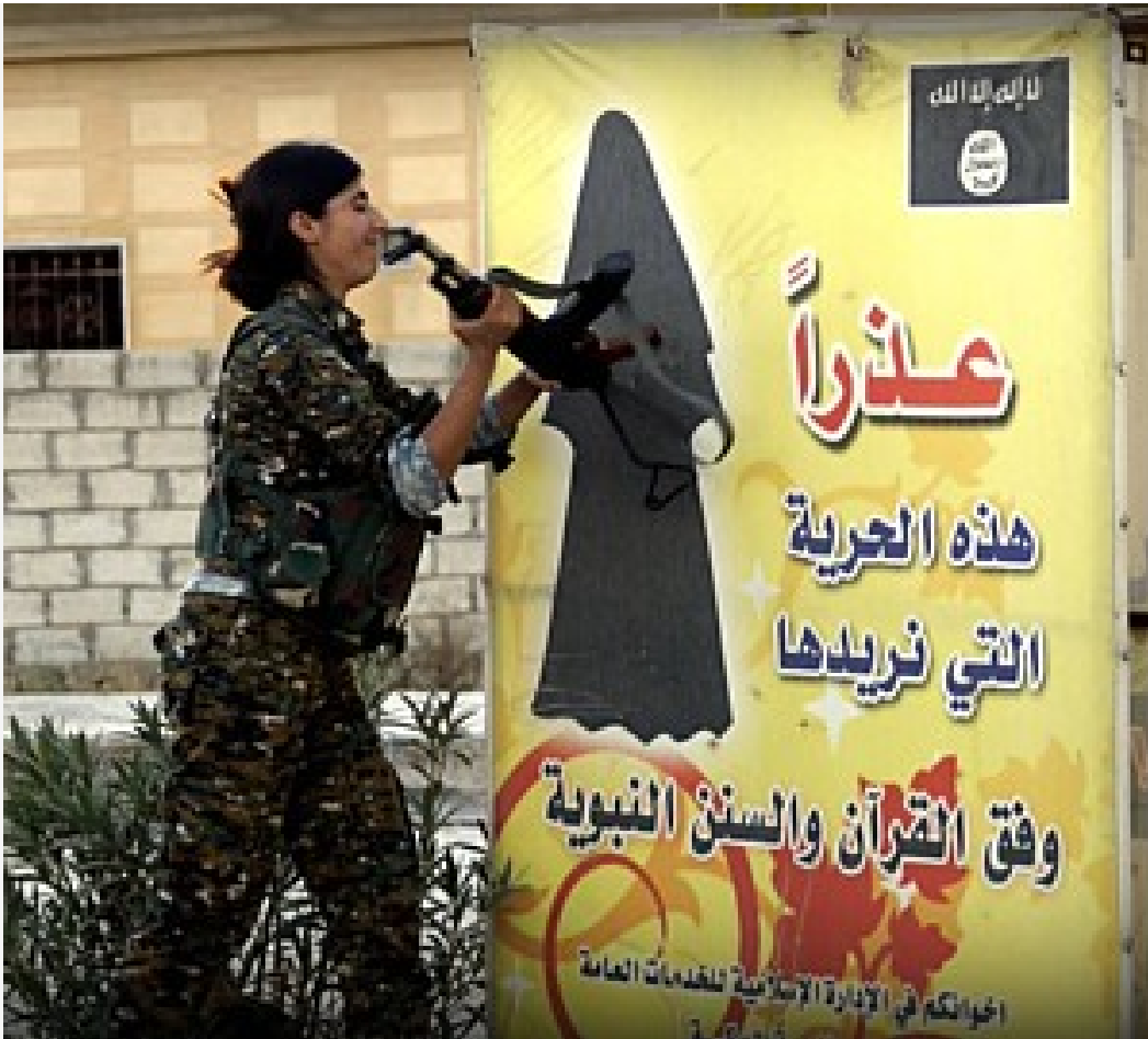
Eine Kämpferin der Frauenverteidigungseinheiten YPJ zerstört bei der Befreiung Nord- und Ostsyriens vom IS ein Plakat des IS mit Anordnungen für die Kleidung der Frauen

mit den Frauen in Vietnam und gegen den Krieg, mit denen in Chile für die Unidad Popular und gegen den Faschisten Pinochet, für Kämpferinnen in Nicaragua, El Salvador, Kuba und heute mit den Frauen in Rojava, denen in den Textilfabriken in Indien und Bangladesh.