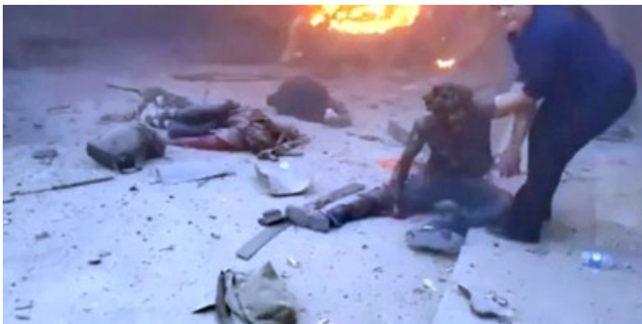
Bombardierung eines zivilen Konvois am 13.10.19; elf Menschen wurden getötet, 74 verletzt

Wir haben auch erfahren, dass Gebiete im Norden Syriens, wie Afrin, al-Bab, Jarablus und Azaz, die bereits unter der Kontrolle türkischer Streitkräfte und/oder angeschlossener bewaffneter Gruppen stehen, weiterhin mit Gesetzlosigkeit und grassierender Kriminalität und Gewalt zu kämpfen haben. Wir haben konkrete Berichte über Einschüchterung, Misshandlung, Tötung, Entführung, Plünderung und Beschlagnahme von Häusern von Zivilist*innen durch die türkisch unterstützten bewaffneten Gruppen in diesen Gebieten erhalten."